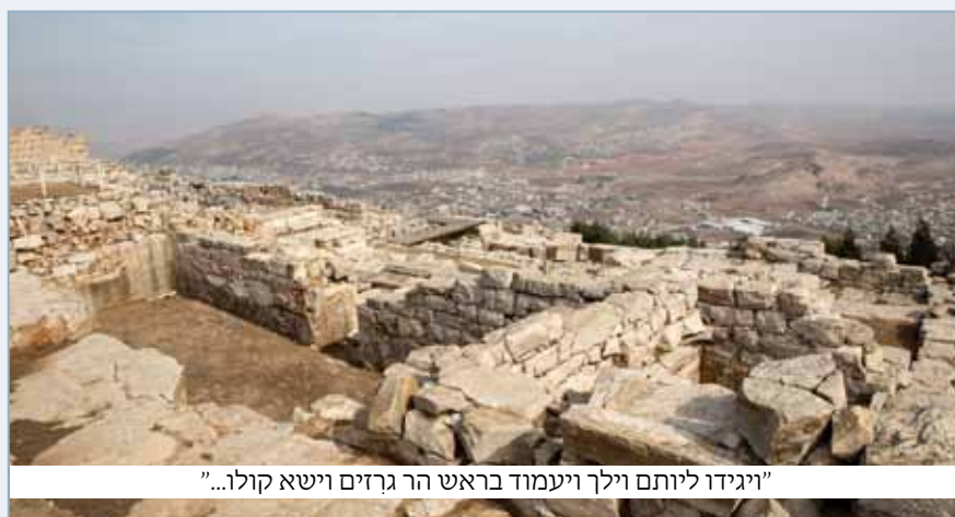
"ויגידו ליותם וילך ויעמוד בראש הר גרזים וישא קולו..."