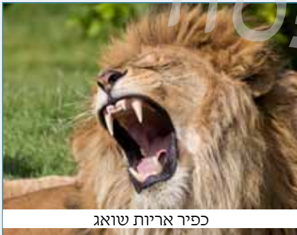
כפיר אריות שואג

7. שמשון שב לקחת את האישה מתמנה. תארו מה קרה בדרך.