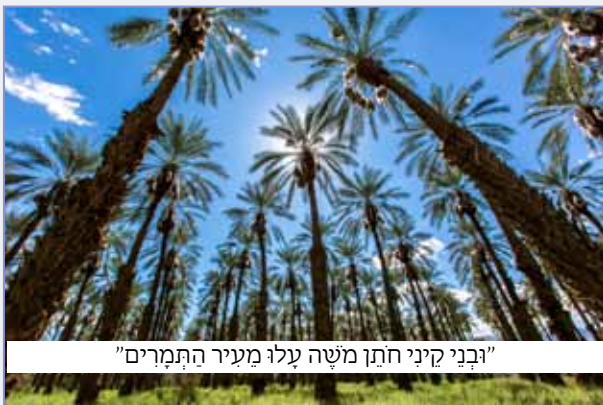
"ובני קיני חתן משה עלו מעיר התמרים"